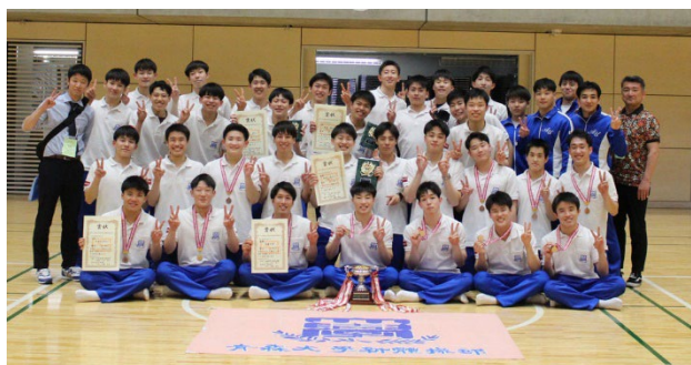
青森大学新体操部

新体操・チアリーディング・集団行動の異なる競技をするアスリートが力を合わせてひとつのチームとして、「ほけんの窓口」の門をくぐるシーンは圧巻です。